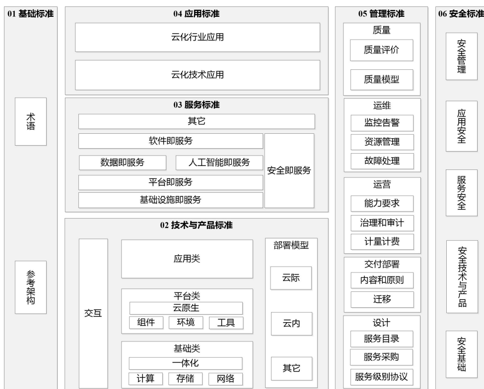
图 1 云计算综合标准化体系结构图

其中，01 基础标准用于统一云计算概念和技术架构等，为制定其他各部分标准提供支撑。主要包括云计算术语、参考架构等方面的标准。