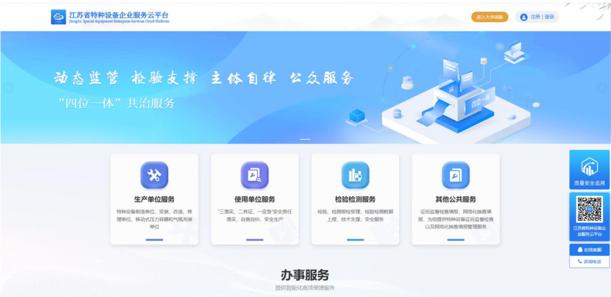
图 D.2 平台登录界面

平台登录界面如图D.2所示，提供企业登录、人员登录两种登录模式，其中企业登录采用平台统下发的企业账号(企业统一社会信用代码)登录；人员登录采用人员身份证号登录。