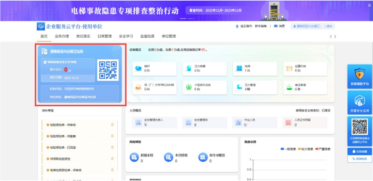
图 D.3 平台工作桌面